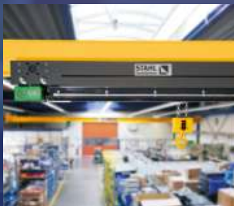
Polipasto de cadena