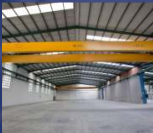
Grua puente y pórtico

Disponemos de una amplia gama de productos orientados a las necesidades productivas y ergonómicas de los clientes.