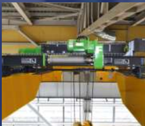
Polipasto de cable